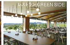
レストラン GREEN SIDE

「英虞湾の真珠」をイメージしたインテリアは、まさにNEMU GOLF CLUBならではの演出です。洗練されたリゾート空間で、寛ぎのひとときをお過ごしください。