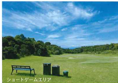
ショートゲームエリア