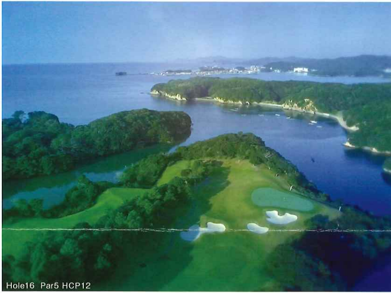
Hole16 Par5 HCP12

英虞(あご)湾を望む雄大なロケーション、チャレンジングな海越えのホール。 シーサイドコースの全ての要素が凝縮された、NEMU GOLF CLUBをお愉しみください。