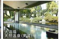
大浴場 天然温泉(男湯)