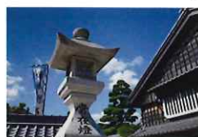
伊勢神宮・おかげ横丁