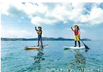
SUP(スタンドアップパドルボード)

約7000㎡を有するショートゲーム専用エリア。 アプローチグリーン2面、バンカーを3つ備え、距離のあるアプローチや実践的なバンカーの練習ができます。 ゴルフ合宿に最適な練習スペースです。