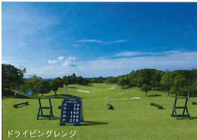
ドライビングレンジ